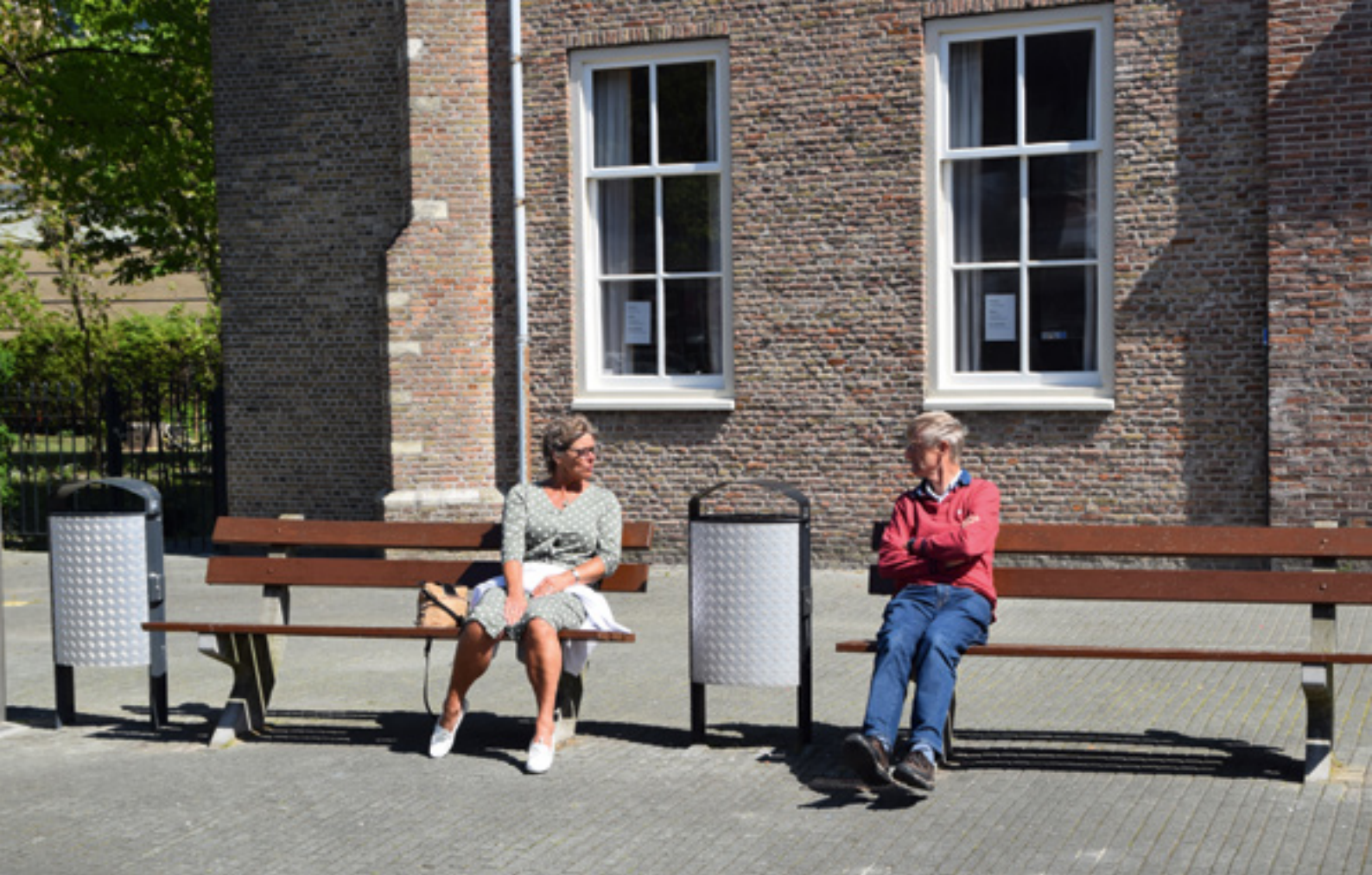
▲ Fysieke ontmoetingen blijven onmisbaar voor contact.

derproject had baat bij een dagje naar een pretpark met de kinderen erbij. Zo leerden ze elkaar kennen, het gaf energie en serieuze gespreksonderwerpen kwamen die dag bijna vanzelf aan de orde. De les: het realiseren van welzijnsdoelstellingen is een bijproduct van plezierige activiteiten. We moeten de kunst van het creëren van aanleidingen beter in de vingers krijgen.